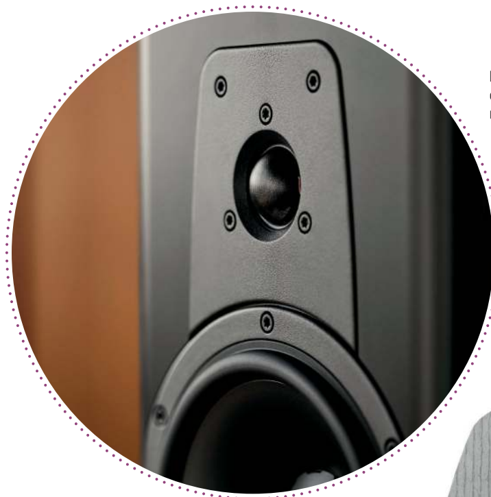
Esotar-diskantilla on osansa Dynaudion menestyksessä.

Laatu ilmeni myös siinä, kuinka kaiutin kykeni erottelemaan tapahtumahorisonttia. Esimerkiksi Indialucian Acatao-kappaleella